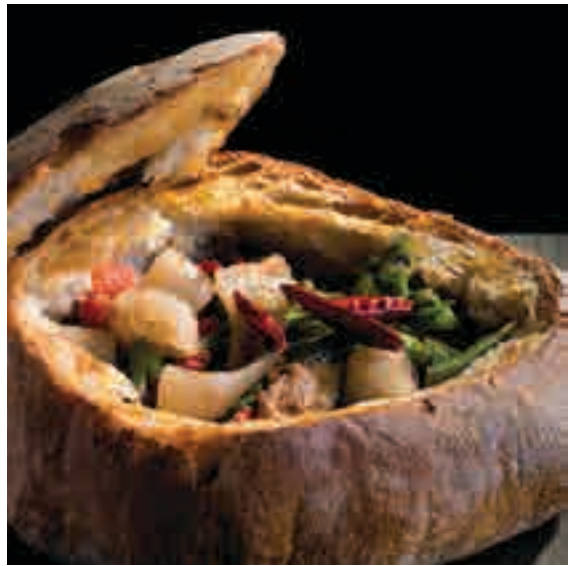
La ciambotta, piatto tipico della Basilicata