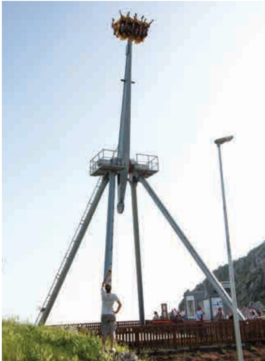
Divertimento assicurato al Parco delle Stelle sul Monte Serra Pollino a Trecchina