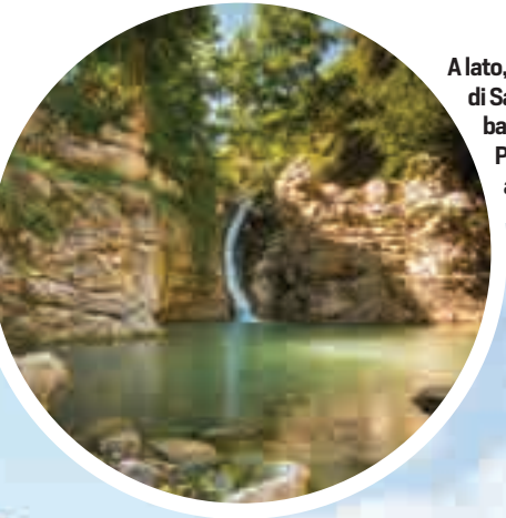
A lato, le Cascate di San Fele. In basso, Piazza Prefettura a Potenza