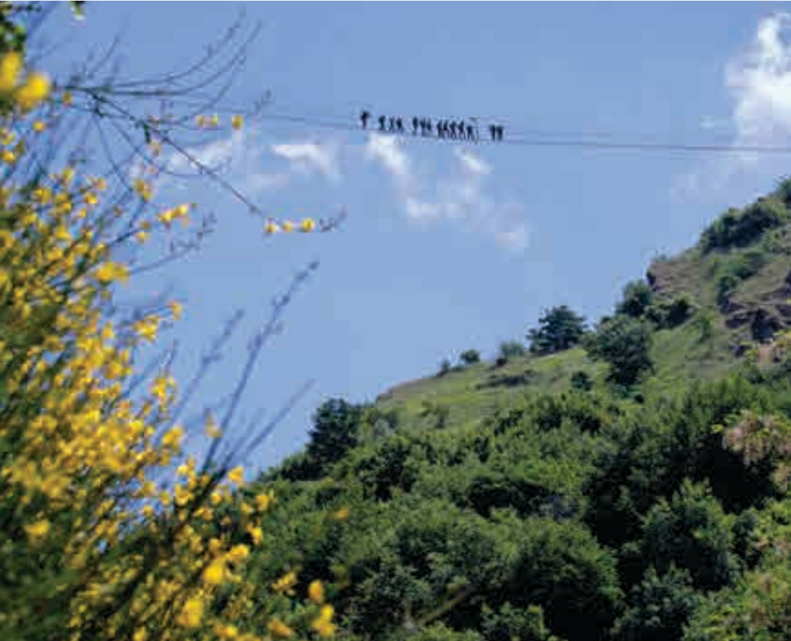
Il Ponte alla Luna, un percorso di 300 metri sospesi nel vuoto a 120 metri di altezza a Sasso di Castalda

“ VOLO DELL'ANGELO SOSPESI TRA LE VETTE DELLA BASILICATA PER UN'AVVENTURA MOZZAFIATO