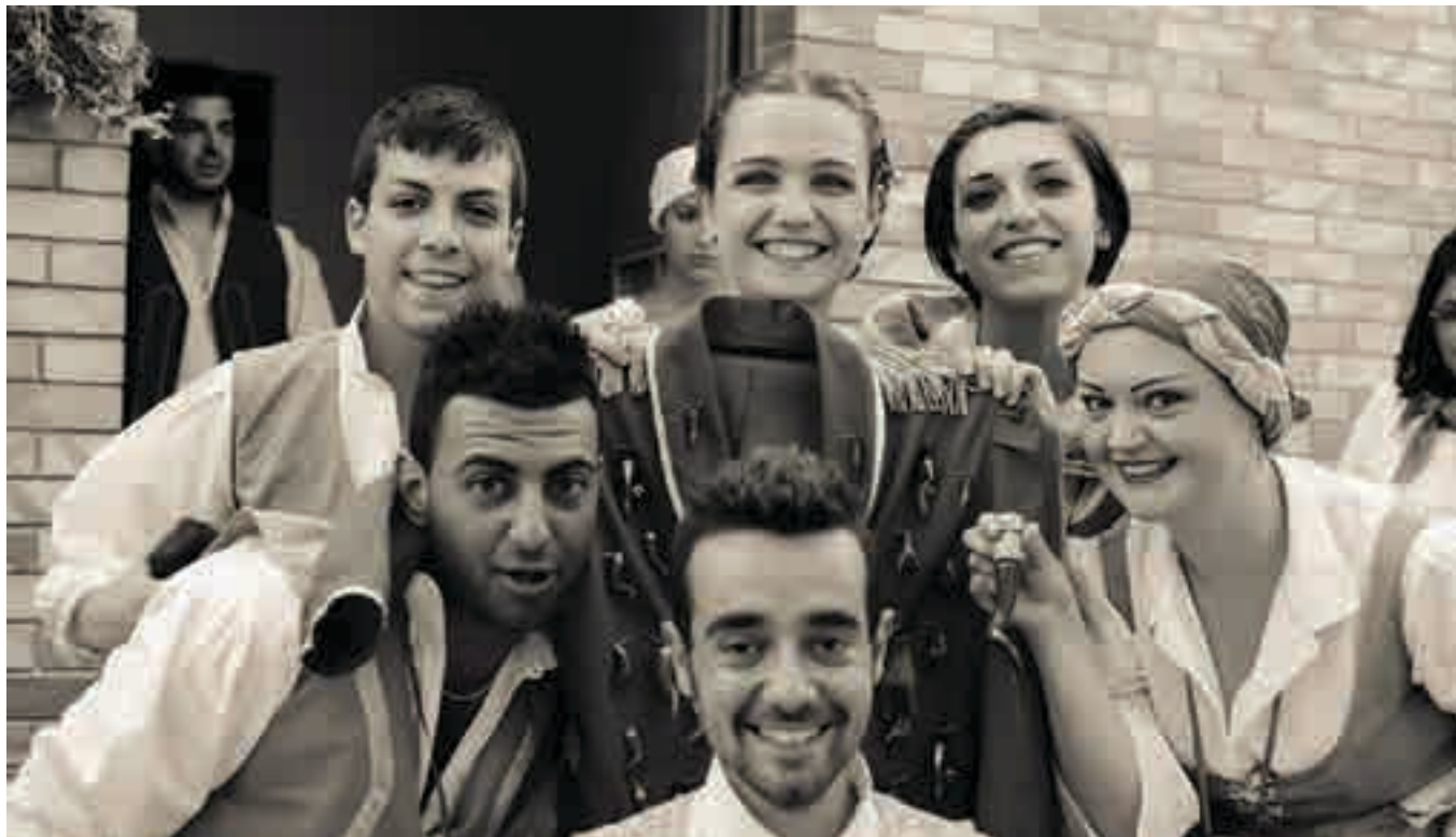
Ottava edizione per Sogno di una notte a Quel paese, meraviglioso viaggio a Colobraro tra Magico e Fantastico

si nel vuoto e provare per qualche minuto l'ebbrezza del volo.