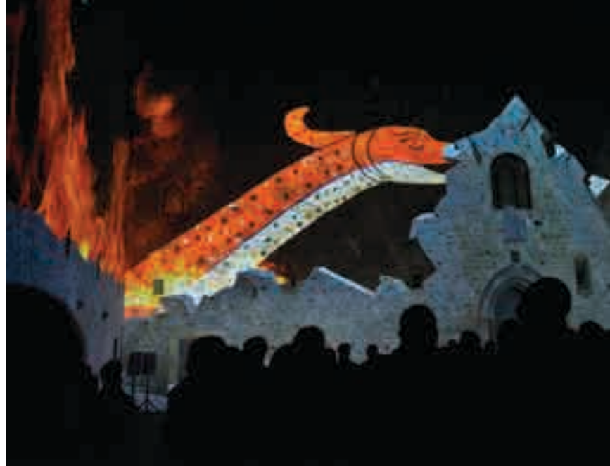
Proiezioni sulle pareti della corte del Castello di Lagopesole, residenza dell'imperatore Federico II

La corte del Castello di Lagopesole, residenza di caccia dell'Imperatore Federico II, è la protagonista di un grande spettacolo che si svolge tra proiezioni sulle pareti interne e sulla ritmica di una narrazione dinamica e intensa; un viaggio nel tempo e nelle vicende del maniero e dei suoi protagonisti. Le immagini si sovrappongono sulle pareti del castello destrutturandole e scomponendole al servizio della rappresentazione, mentre la voce e il volto di Remo Gionne si prestano a narrare gli amori e le vicende del grande Imperatore.