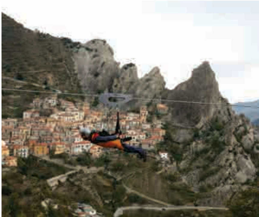
La linea Peschiere: In volo da Castelmezzano (1019 metri) a Pietrapertosa (888 metri)

Tutti i percorsi suggeriti per scoprire i paesaggi più belli della Basilicata