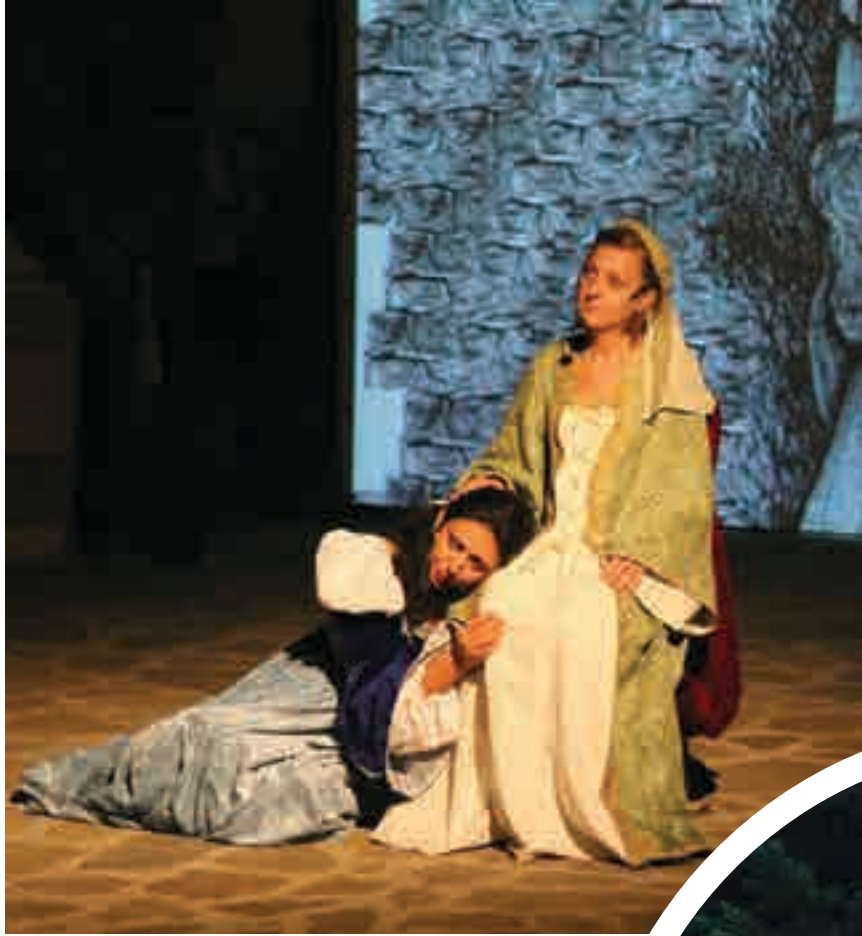
Il Parco Letterario dedicato a Isabella Morra nel borgo di Valsinni

Sul Monte Serra Pollino, precisamente nel comune di Trecchina è possibile godere di una vista spettacolare, un panorama naturalistico che affaccia sulla costa Tirrenica di Maratea e della Calabria. Il percorso inizia con la Via Lattea, una slittovia che snoda in un viale alberato e che permette ai visitatori una discesa mozzafiato a tutta velocità. Ma l'attrazione principale è il Big Bang: una grande alta-