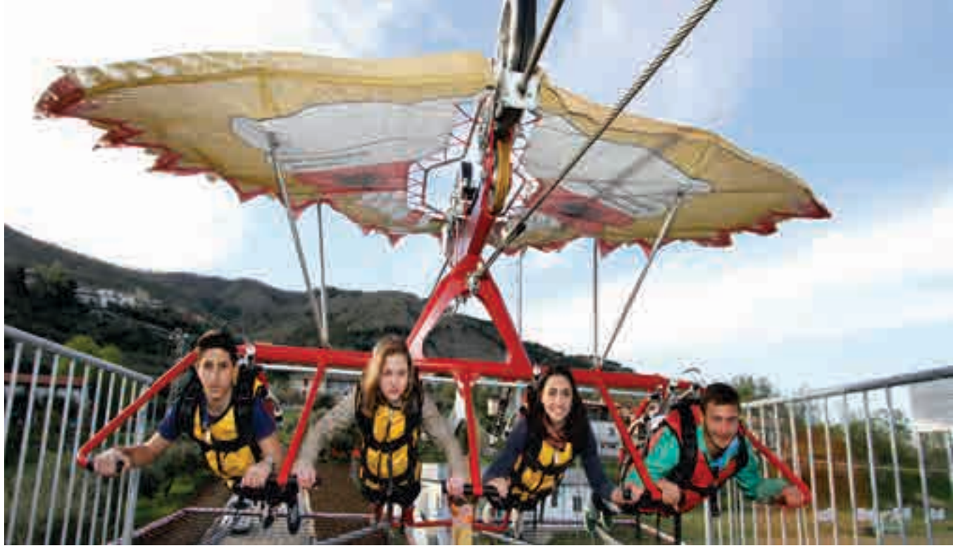
Esperienza adrenalinica con il Volo dell'Aquila, attrattore turistico a San Costantino Albanese