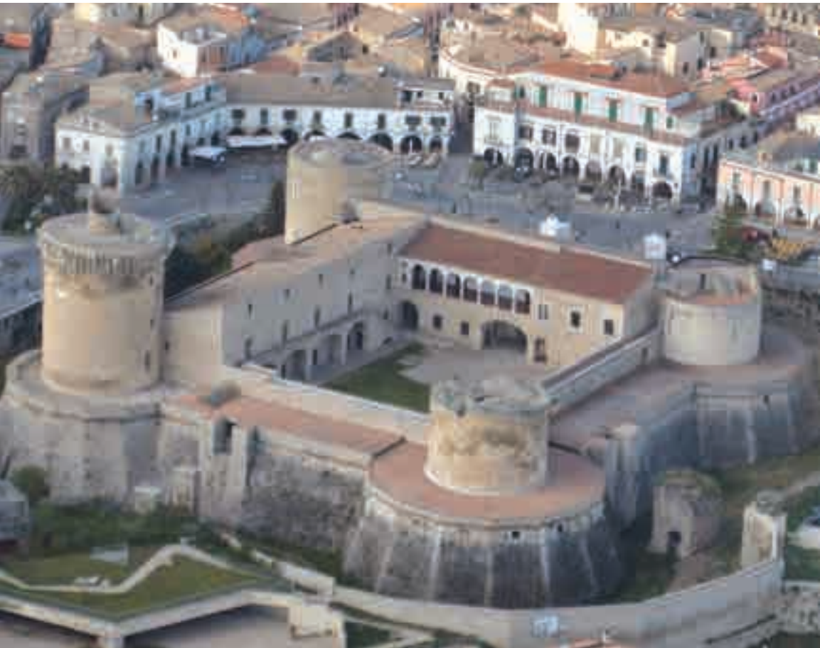
Il Castello Pirro del Balzo è sede del Museo Archeologico Nazionale di Venosa