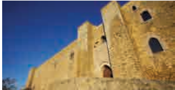
Il Castello di Lagopesole, dimora medievale di Federico II