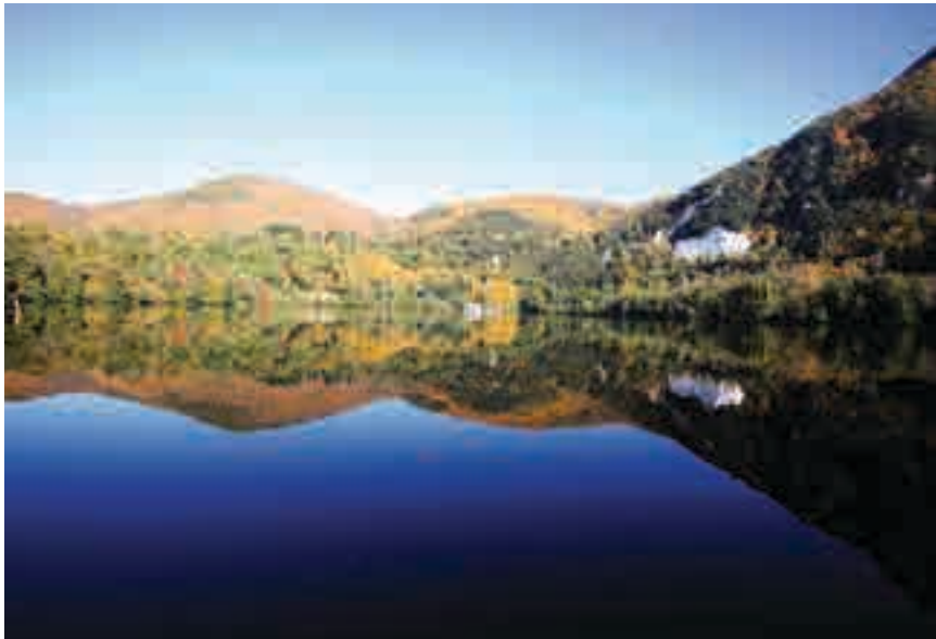
L'incantevole paesaggio dei Laghi di Monticchio