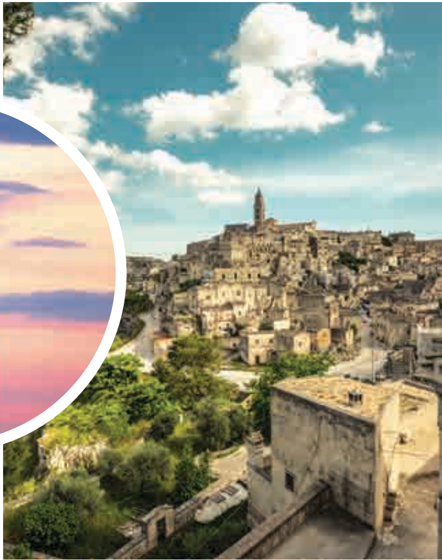
A Matera il tempo sembra essersi fermato: qui si fondono mistero e natura incontaminata

la più grande cisterna idrica della città e si trova sotto la famosissima piazza Vittorio Veneto. Matera è una scoperta continua, il diamante luminoso della Basilicata che non si può fare a meno di visitare.